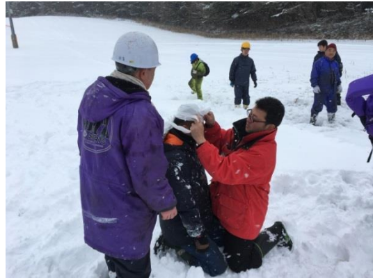
9・安全マネジメントに係る人材教育