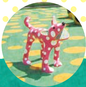
草間彌生 「リンリン」