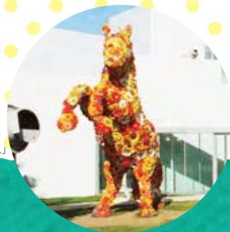
チェ・ジョンファ 「フラワー・ハウス」