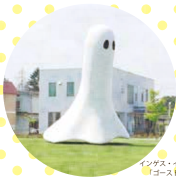
インゲス・イデー 「ゴースト」